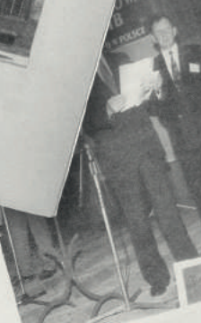
Podziękowanie dla sponsora: